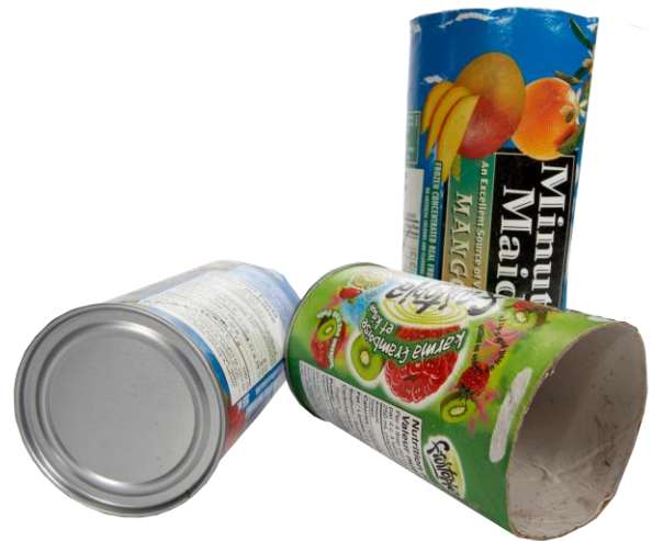
Boîtes en carton (jus congelés)