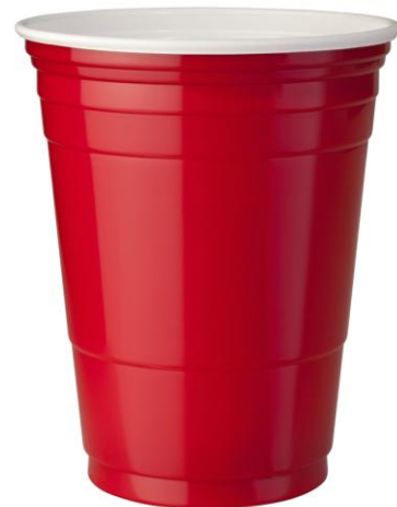
Gobelets en plastique