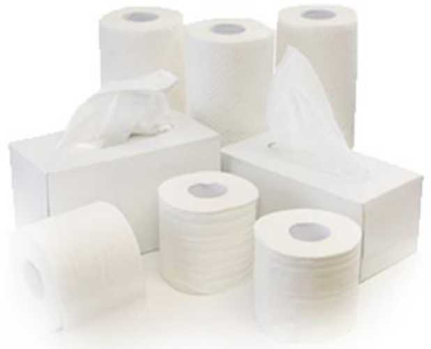
Mouchoirs et essuie-tout