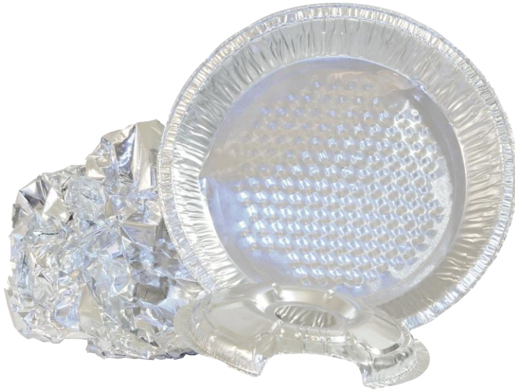
Papier d'aluminium et assiettes en aluminium