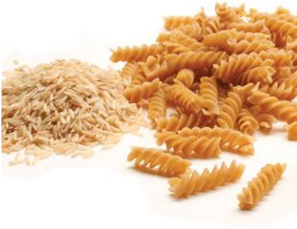
Pâtes et riz