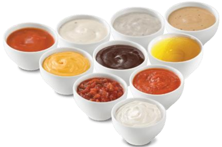
Sauces et trempettes