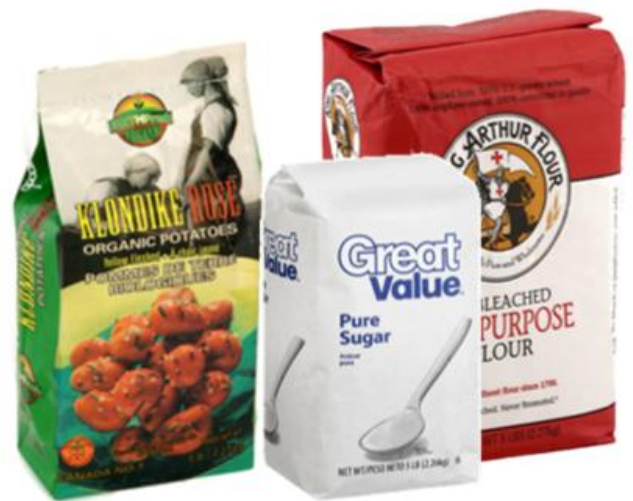
Sacs de farine/sucre/patates ou de maïs soufflé