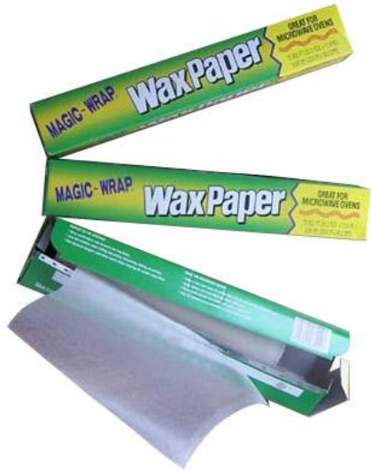
Papier à congélation, papier ciré et papier-parchemin