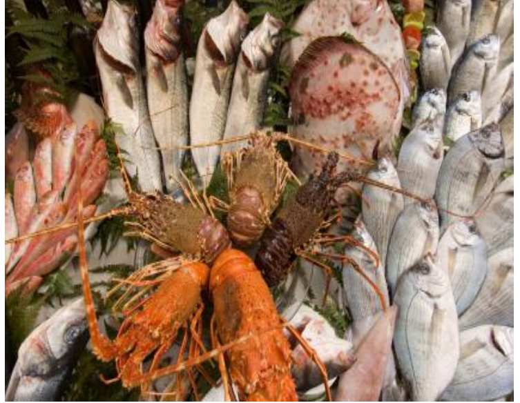
Poissons et fruits de mer