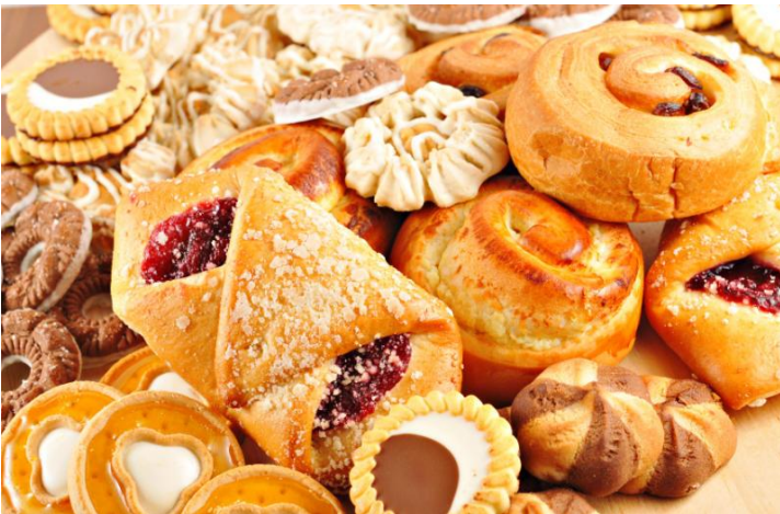
Produits et ingrédients de boulangerie