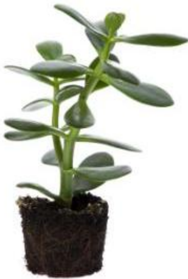
Plantes d'intérieur et terreau