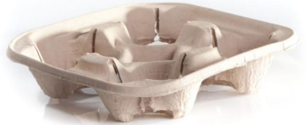
Plateaux à emporter en papier