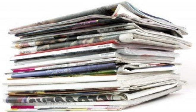
Journaux et revues