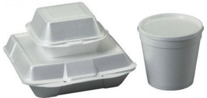
Contenants en mousse rigide