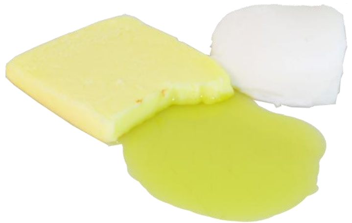
Huile, graisse et gras refroidis