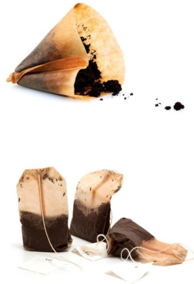
Filtres de café et sachets de thé