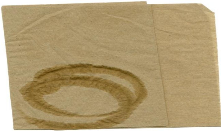
Serviettes en papier