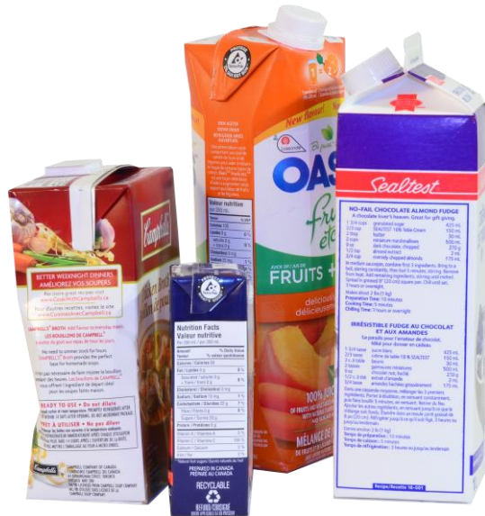
Contenants en carton (jus, lait)