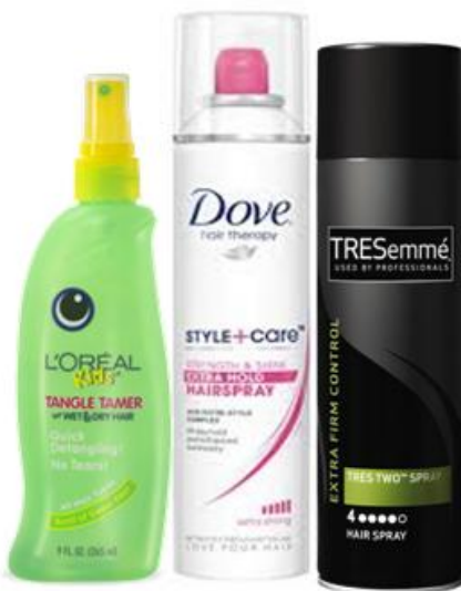
Bombes aérosol / bouteilles pour laque pleines ou partiellement vides