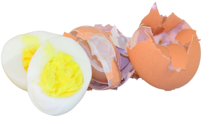
Œufs et coquilles