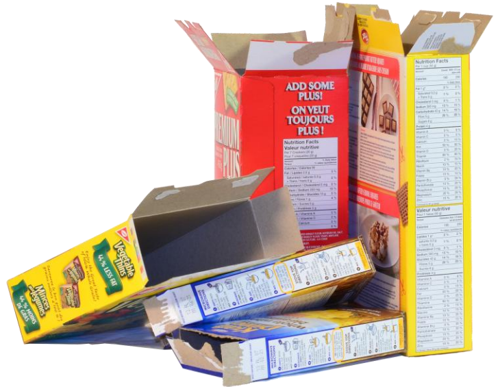
Carton pour boîtes