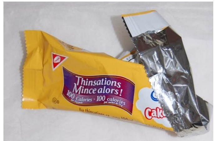
Emballages en aluminium