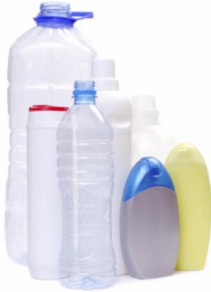
Contenants en plastique (symboles 1, 2, 4, 5, 6)