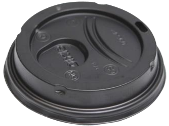
Couverts en plastique sur les gobelets à emporter