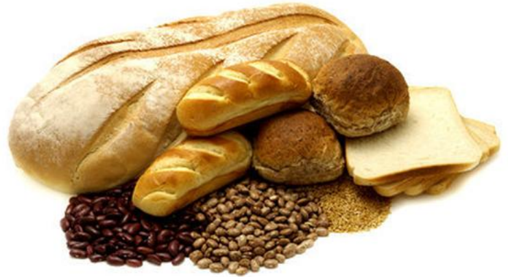
Pains et céréales