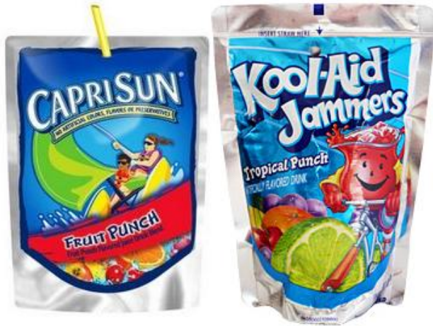
Sachets à jus en pellicule d'aluminium