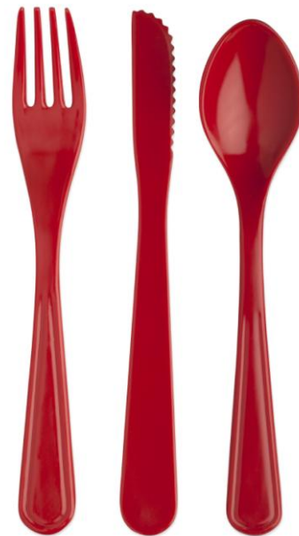
Ustensiles en plastique