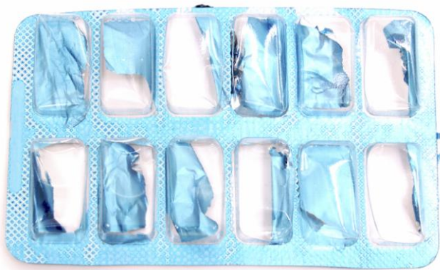
Emballages-coques en plastique