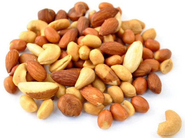
Noix et écales