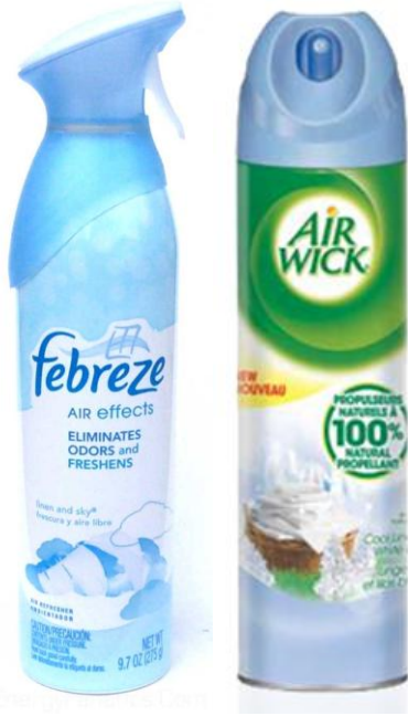
Bombes aérosol pleines ou partiellement vides