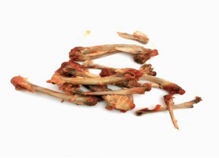
Poulet et os