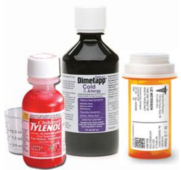
Médicaments et prescriptions