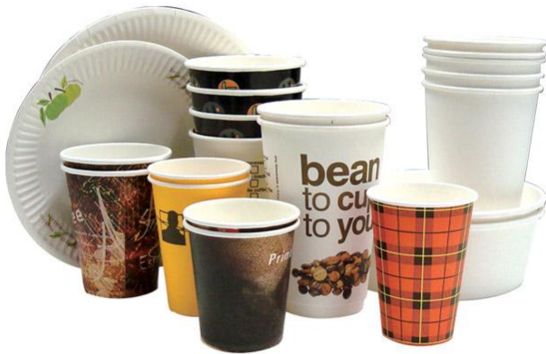
Assiettes, gobelets et contenants à emporter en papier