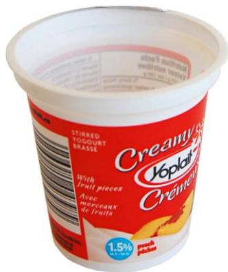
Contenants de yogourt