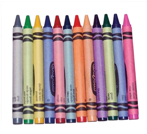
Craies de cire