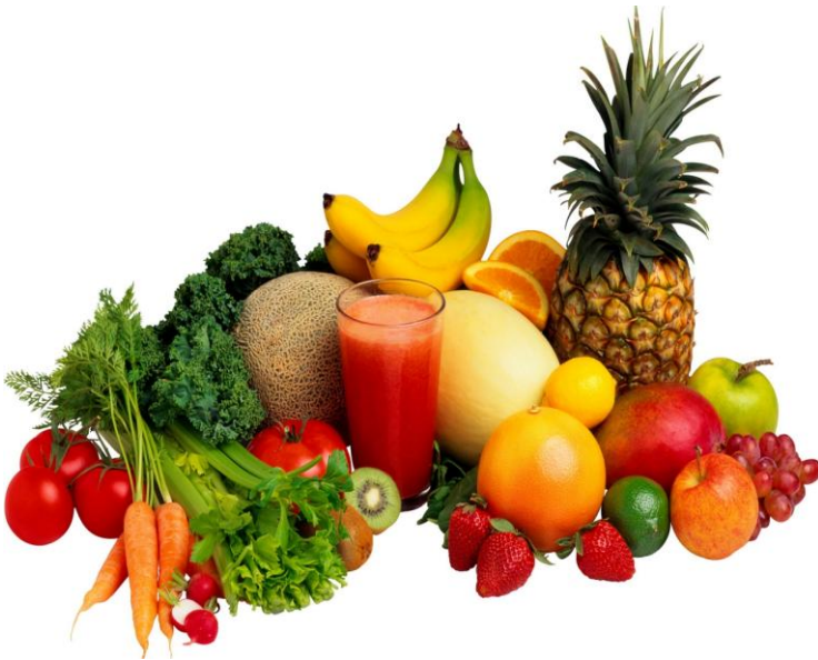
Fruits et légumes