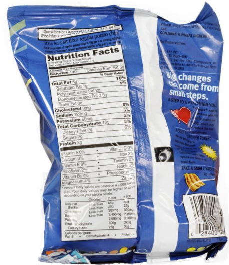
Sacs à croustilles