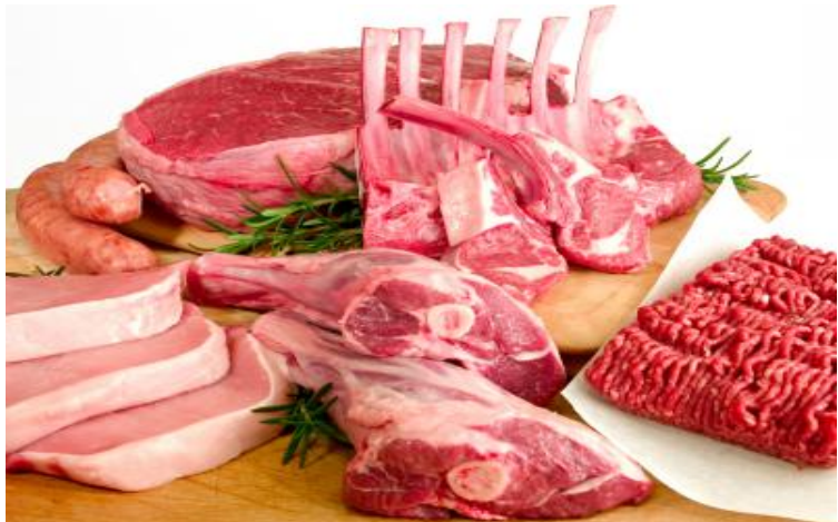
Viande et os