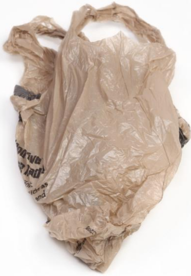
Sacs en plastique