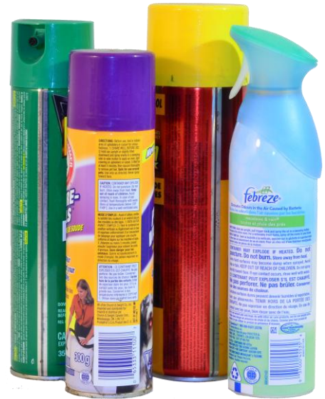
Bombes aérosol vides