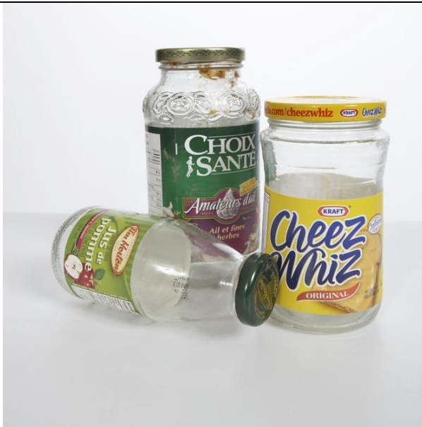
Contenants de verre