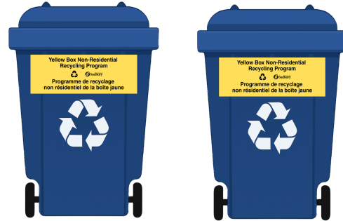
2 contenants de recyclage (360 litres chacun = 720 litres en tout)