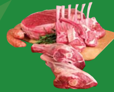
Meat and bones Viande et os