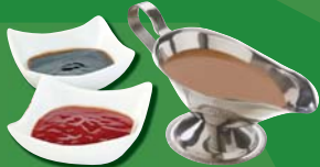
Sauces and gravy Sauces