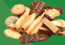
Baked goods and ingredients Produits et ingrédients de boulangerie