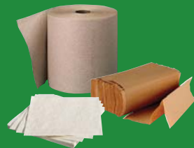
Tissues, napkins, paper towels and cotton balls Mouchoirs, serviettes, essuie-tout et boules d'ouate en coton