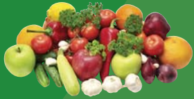
Fruits and vegetables Fruits et légumes