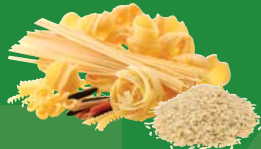
Pasta and rice Pâtes et riz