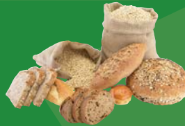
Breads and grains Pains et céréales