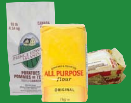
Sugar/flour/potato/popcorn bags Sacs de sucre, de farine, de patates ou de maïs soufflé