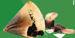
Coffee grounds/filters/tea bags Marc de café, filtres et sachets de thé