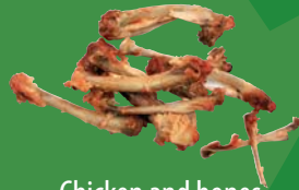
Chicken and bones Poulet et os