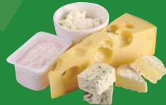
Dairy products Produits laitiers