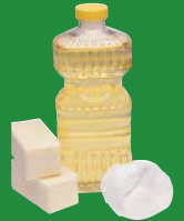
Cooled grease, fat and cooking oil Huile, graisse et gras refroidis