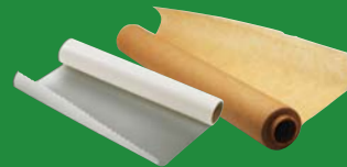
Freezer, waxed and parchment baking paper Papier à congélation, papier ciré et papier-parchemin