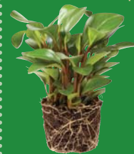
House plants and soil Plantes d'intérieur avec terreau