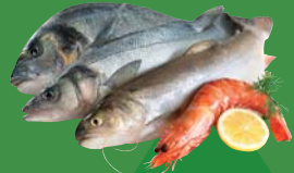
Fish, seafood and shells Poisson et fruits de mer