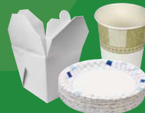
Paper plates, cups and takeout containers Assiettes, gobelets et contenants à emporter en papier