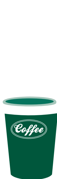
2 $ Un grand café – 563 ml