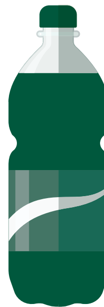
2 $ Une bouteille de 2 l de boisson gazeuse