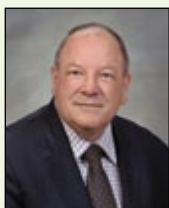
Le maire Brian Bigger 311