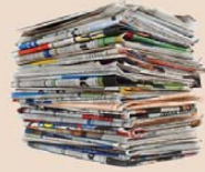
Journaux, magazines, catalogues, encarts, annuaires téléphoniques et livres