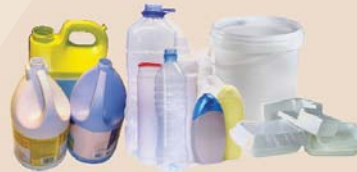
Bouteilles, cruches, bacs, seaux et plateaux de plastique, emballage en mousse rigide (plastiques numéro 1, 2, 4, 5 et 6, rincer)