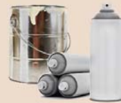
Contenants de peinture et bombes aérosol vides (vider et sécher, enlever les couvercles)