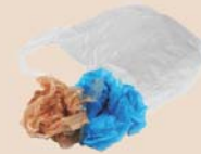
Sacs en plastique extensible (sans reçus en papier)