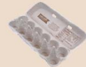
Boîtes à œufs (de papier et en mousse)