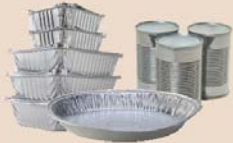
Boîtes métalliques et en aluminium, papier aluminium, moules à tarte et plateaux en aluminium (rincer)