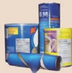
Boîtes en carton