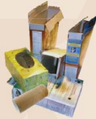
Boîtes à céréales et à papier-mouchoir rouleaux cartonnés (aplatissez à une taille de 30" x 30" et enlevez tous les plastiques)