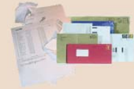
Papiers domestiques et sacs en papier non traité