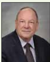
Le maire Brian Bigger 311