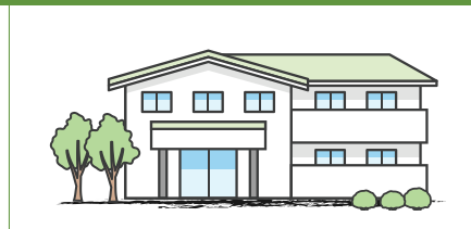
une maison convertie en logements multiples