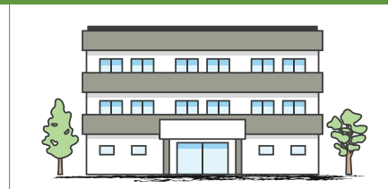
un petit immeuble avec quatre résidences

L'aménagement de quatre logements peut prendre diverses formes, tout en s'intégrant dans le tissu bâti existant.